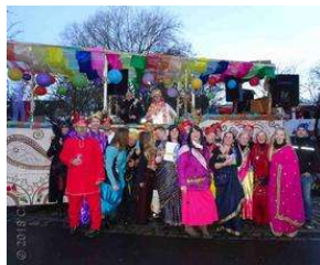
Bergedorferin freut sich königlich beim Marneval von Charlene Wolff