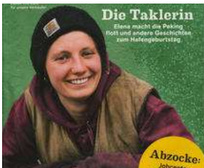
AB MITTWOCH auf dem Lohbrügger Markt !! von Erich Heeder