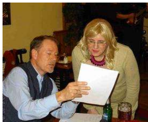
7 Jahre TextLabor Bergedorf - eine ganz besondere offene... von Charlene Wolff