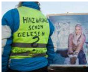
SIE kommt spät - aber sie KOMMT !! von Erich Heeder