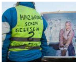
SIE kommt spät - aber sie KOMMT !! von Erich Heeder