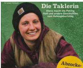
AB MITTWOCH auf dem Lohbrügger Markt !! von Erich Heeder