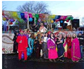
Bergedorferin freut sich königlich beim Marneval