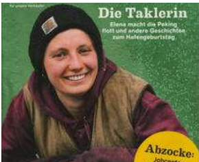
AB MITTWOCH auf dem Lohbrügger Markt !! von Erich Heeder