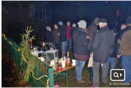
Nachbarschaftstreff im Orkan "Billie" in Lohbrügge