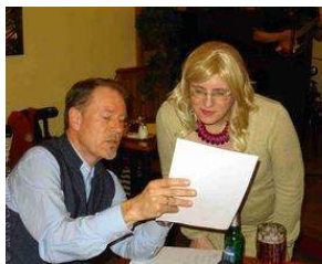
7 Jahre TextLabor Bergedorf - eine ganz besondere offene... von Charlene Wolff