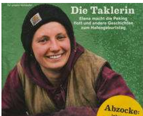
AB MITTWOCH auf dem Lohbrügger Markt !! von Erich Heeder