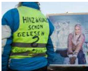
SIE kommt spät - aber sie KOMMT !! von Erich Heeder