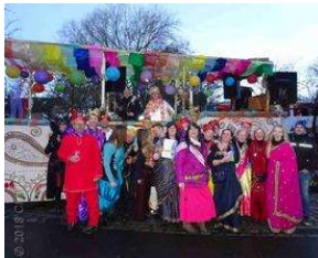
Bergedorferin freut sich königlich beim Marneval von Charlene Wolff