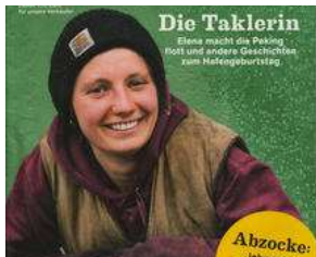
AB MITTWOCH auf dem Lohbrügger Markt !! von Erich Heeder