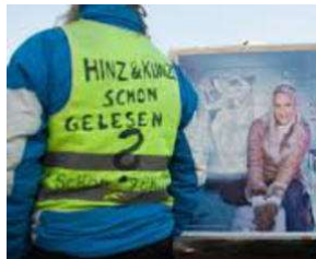
SIE kommt etwas später - aber sie KOMMT !! von Erich Heeder