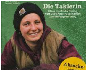
AB MITTWOCH auf dem Lohbrügger Markt !!