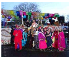
Bergedorferin freut sich königlich beim Marneval