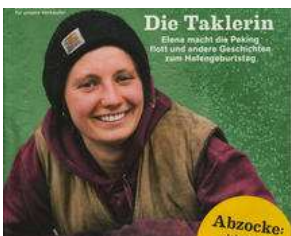
AB MITTWOCH auf dem Lohbrügger Markt !! von Erich Heeder