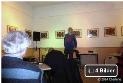
4 Bilder

Hamburg: Bürgerhaus Eidelstedt | Das TextLabor Bergedorf hat als Vorlage gedient für die offene Lesebühne "Eidelstedter Poeten" , die sich alle zwei Monate am dritten Mittwoch im Eidelstedter Bürgerhaus trifft. Petra Klose , die das TextLabor B gegründet hat, war regelmäßig dabei, und diese Tradition setzt auch ihre Königin Charlene fort, wann immer sie es einrichten kann.