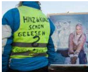
SIE kommt etwas später - aber sie KOMMT !! von Erich Heeder