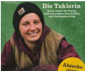
AB MITTWOCH auf dem Lohbrügger Markt !! von Erich Heeder