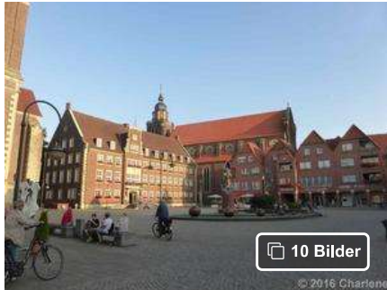
Der Marktplatz von Coesfeld