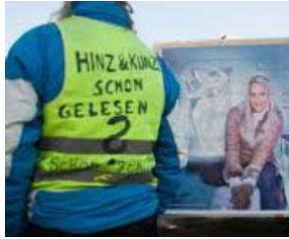
SIE kommt spät - aber sie KOMMT !! von Erich Heeder