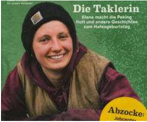
AB MITTWOCH auf dem Lohbrügger Markt !! von Erich Heeder